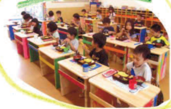
年長.. マイテスク使っているよ！