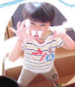
つきみ おばけやしき開催 年中さんもおびにきて くまをいたる