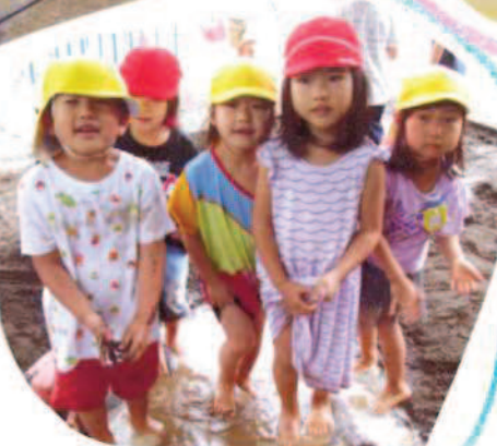
水あそび はだして気持ち良いね♪