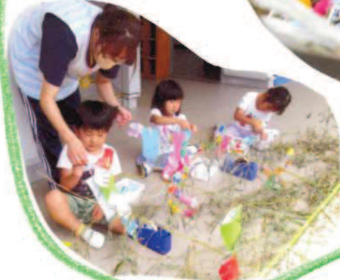
七夕かざりつけ お願いはかなったかな？