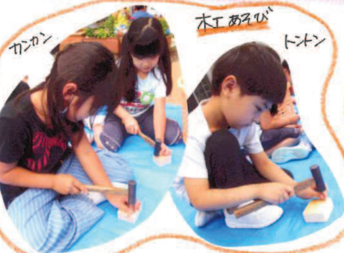
カンカン 木打あそび トントン